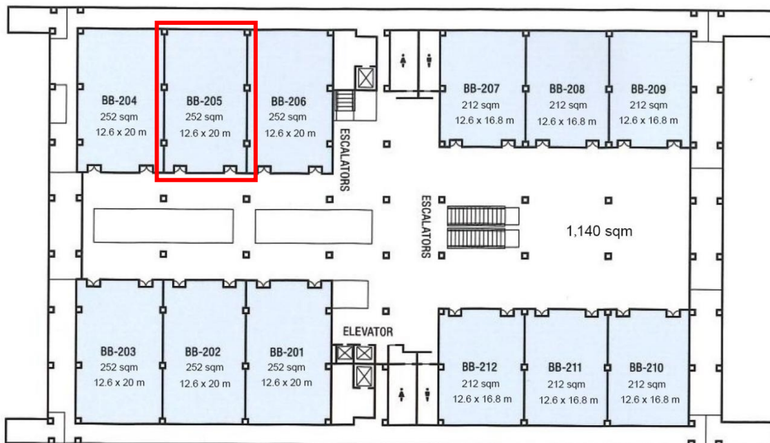
VCC 2nd Floor