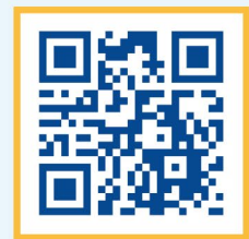
สารคดีสั้น “สังคมสงบสุข”