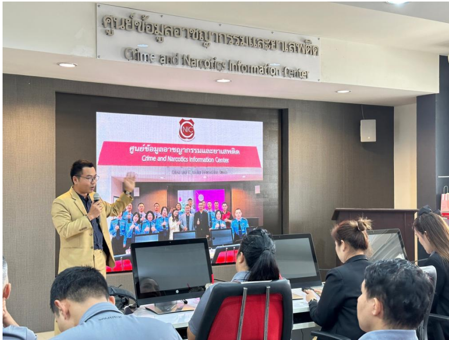
ภาพ : การบรรยายให้ความรู้เกี่ยวกับศูนย์ข้อมูลอาชญากรรมและยาเสพติด

๒.๑ ศูนย์ข้อมูลอาชญากรรมและยาเสพติด (Crime and Narcotics Information Center) จัดตั้งขึ้นเพื่อเป็นแหล่งข้อมูลสำหรับใช้ในการเรียนของนักเรียนโรงเรียนนายร้อยตำรวจ รวมถึงเป็นแหล่งสืบค้นข้อมูล โดยมีระบบสารสนเทศตำรวจที่ใช้ในการสืบค้นข้อมูลต่างๆ อาทิ การตรวจสอบข้อมูลอาวุธปืน และข้อมูลยานพาหนะที่เกี่ยวข้องกับยาเสพติด ซึ่งสามารถใช้เป็นข้อมูลในการสกัดกั้นการลำเลียงยาเสพติด นอกจากนี้ยังมีระบบ IP CCTV ที่ใช้ในการจำลองการเก็บข้อมูล CCTV การจำลองเหตุอาชญากรรม ซึ่งข้อมูลดังกล่าวยังใช้ในการเรียนการสอนนักศึกษา หลักสูตรนิติวิทยาศาสตร์