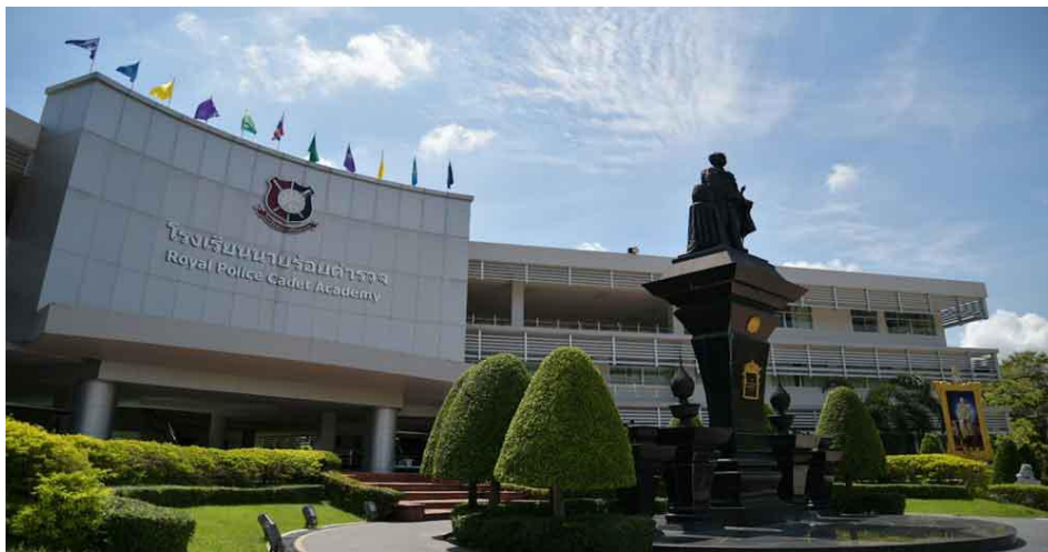
ภาพ : โรงเรียนนายร้อยตำรวจ

โรงเรียนนายร้อยตำรวจ เป็นหน่วยงานระดับกองบัญชาการ สังกัดสำนักงานตำรวจแห่งชาติ โดยเป็นสถาบันการศึกษาระดับอุดมศึกษา ตั้งอยู่ที่ อำเภอสามพราน จังหวัดนครปฐม มีภารกิจหลักในการฝึกอบรม ให้การศึกษา อบรมหล่อหลอมนักเรียนนายร้อยตำรวจให้มีคุณลักษณะเหมาะสมที่จะเป็นนายตำรวจชั้นสัญญาบัตร และฝึกอบรมผู้เข้ารับการอบรมหลักสูตรอื่น โรงเรียนนายร้อยตำรวจ มีการเปิดสอนจำนวน ๔ คณะ ประกอบด้วย คณะตำรวจศาสตร์ คณะนิติวิทยาศาสตร์ คณะสังคมศาสตร์ และคณะนิติศาสตร์ โดยผู้ที่ศึกษาตามหลักสูตรหลักของโรงเรียนนายร้อยตำรวจเรียกว่า “นักเรียนนายร้อยตำรวจ” (นรต.)