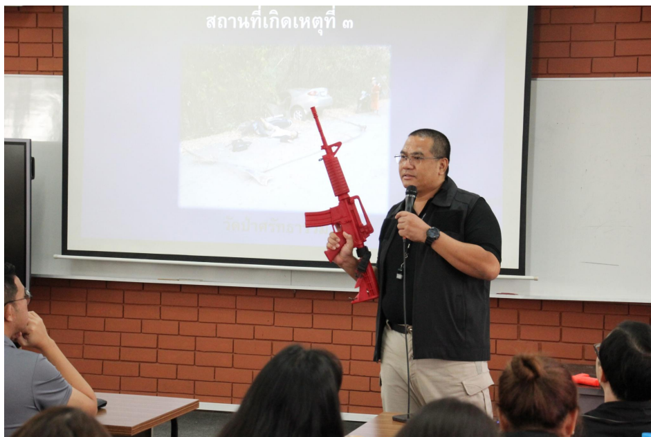
ภาพ : การบรรยายให้ความรู้เกี่ยวกับการรับมือสถานการณ์ฉุกเฉิน : หนี ซ่อน สู้

๒.๓.๔ ความแตกต่างระหว่าง Active Shooter กับ Hostage Situation กล่าวคือ มีความจำเป็นในการที่จะต้องแยกสถานการณ์และความแตกต่างระหว่าง Active Shooter กับ Hostage Situation เพื่อให้เข้าใจสถานการณ์และวิธีการรับมือได้อย่างถูกต้อง