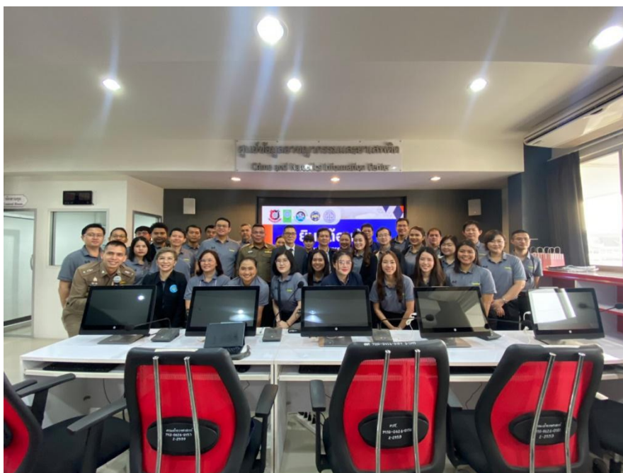
ภาพ : คณะผู้อบรมหลักสูตรการป้องกันอาชญากรรมกับการอำนวยความสะดวกธุรกรรมในสังคม Crime Prevention รุ่นที่ ๗ เข้าศึกษาดูงานศูนย์ข้อมูลอาชญากรรมยาเสพติด