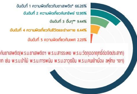
5 อันดับประเภทคดีที่มีอัตราการกระทำผิดซ้ำของผู้ต้องขังที่ได้รับการปล่อยตัวในเมืองปทุมธานี 2565

ผู้กระทำความผิดซ้ำในคดียาเสพติดให้โทษ คดีความผิดเกี่ยวกับทรัพย์สิน คดีความผิดเกี่ยวกับเพศ มักมีพฤติกรรมที่ไม่เกรงการลงโทษของกฎหมาย ทำให้เกิดเครือข่ายและตั้งกลุ่มโดยใช้สื่อออนไลน์เป็นช่องทาง ก่อความวุ่นวาย และก่ออาชญากรรมที่รุนแรงขึ้น ซึ่งปัญหาดังกล่าวนี้ส่งผลกระทบต่อประเทศชาติที่จะต้องเสียกำลังคนและงบประมาณในการป้องกันแก้ไขเยียวยาปัญหาของผู้ที่เคยกระทำความผิด โดยการกระทำผิดซ้ำอาจเกิดจากการใช้สารเสพติด การขาดความรักความเอาใจใส่จากครอบครัว และการยอมรับจากสังคม ทำให้เกิดความโดดเดี่ยว และกลับไปคบเพื่อนที่มีพฤติกรรมเกี่ยวกับยาเสพติดหรือการคบหาสมาคม